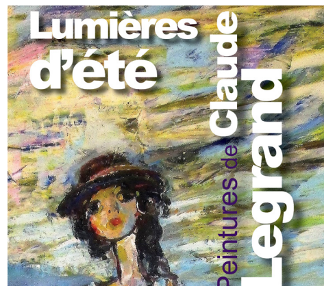
Le festival « Lumières d'été » à Murat du 15 au 17 juillet (plus d'informations page 7)